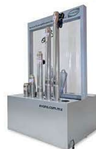
AP-EMLL Módulo Bombas Sumergibles 92 x 150 x 180 cm