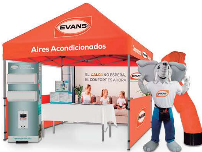
AP-088 Toldo EVANS®