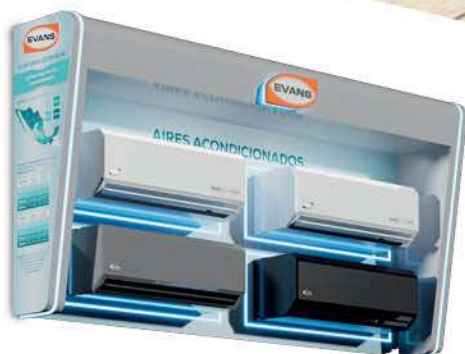
EXH-PARED-AC Exhibidor Pared Aires Acondicionados 240 x 40 x 120 cm