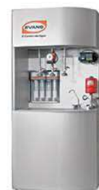
70190052 Módulo Agua 92 x 70 x 210 cm