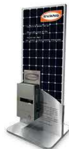
KIT-RACK-PT Exhibidor de Potencia Térmica 100 x 100 x 85cm (No incluye panel)