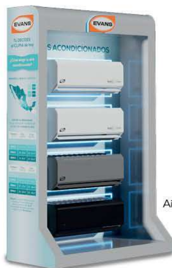
EXH-BASE-AC Exhibidor Base Aires Acondicionados 140 x 60 x 210 cm