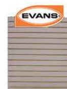
70190022 Respaldo Refacciones 80 x 120 cm